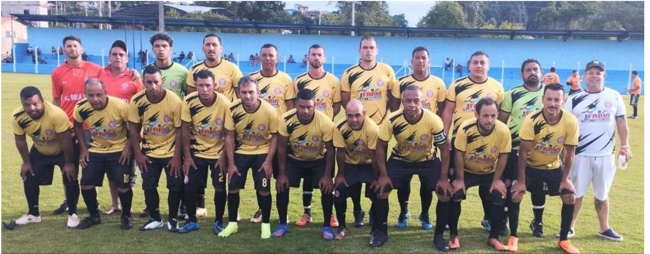
Bela Vista enfrentará o Veterano do Vila Nova de São Miguel Arcanjo neste domingo

Após um descanso no final de semana passada devido ao aniversário de Capão Bonito, a Copa Regional de futebol de campo, que está sendo disputada no bairro dos Proenças, volta a ter rodada neste domingo. Serão três jogos, sendo um pela categoria Veterano e dois pela catego-