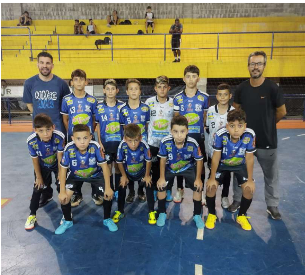
Sub-12 da AECB é formado somente com jogadores da cidade

A equipe Sub-18 da AECB (Associação Esportiva Capão Bonito), que está disputando o Campeonato Metropolitano de futsal para categorias de base da Série A2, promovido pela Federação Paulista de Futsal, conseguiu mais uma vitória na última rodada da competição.