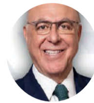
Arnaldo Jardim , deputado federal

Páscoa é momento para solidariedade, cultivar amor e firmar compromisso contra todo tipo de violência. É paz.