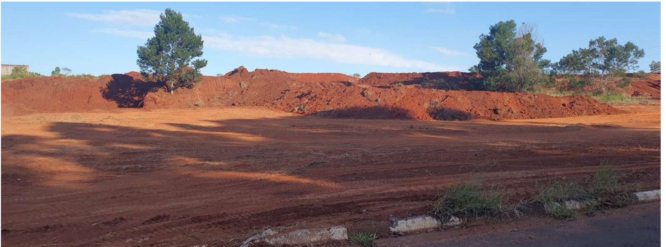
Terreno desapropriado pela prefeitura no Terras dos Embiruçu abrigará pista de motocross

A cidade de Capão Bonito vem tendo várias polêmicas relacionadas ao setor imobiliário. Além do caso da operação da Polícia Civil contra uma quadrilha de grilagem de terras no município que estourou semana passada, a compra de terrenos milionários por parte da prefeitura municipal tem chamado a atenção da população.