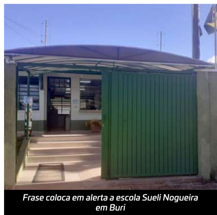
Frase coloca em alerta a escola Sueli Nogueira em Buri

O prefeito ainda finalizou com um alerta aos pais de estudantes. "Senhores pais, acompanhem de perto seus filhos, participem das reuniões nas escolas, se atentem com celulares e, principalmente, dialoguem com eles".