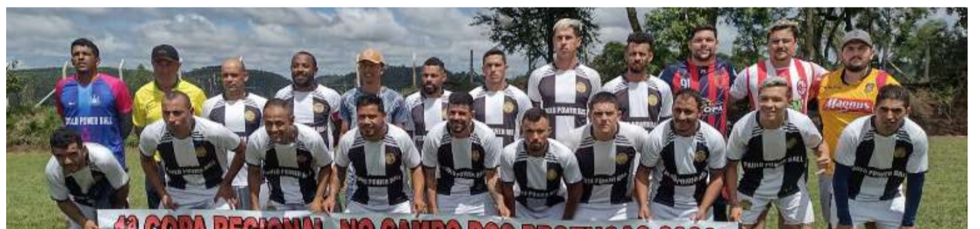
Time do Paulo Power Ball se classifica se não perder jogo contra o E.C. Ferreira dos Matos

Ferreira dos Matos, com o time da zona rural de Ribeirão Grande precisando vencer para se classificar, já que o empate garante a vaga do time do Paulo Power Ball.