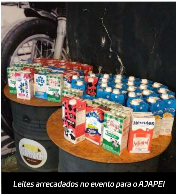
Leites arrecadados no evento para o AJAPEI

No último dia 16, o torneio beneficente 'Mário Kart' arrecadou doações para o lar de idosos AJAPEI. Na ação solidária, realizada pelos jovens de Capão Bonito, ao participar do torneio, além de relembrar do clássico jogo de vídeo game, o competidor contribuía com um litro de leite.