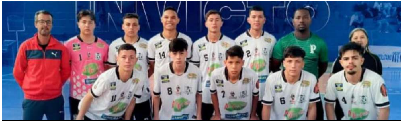
Sub-18 da AECB precisa de um ponto para se classificar no Metropolitano

A equipe Sub-18 da AECB (Associação Esportiva Capão Bonito) perdeu seus dois últimos jogos pelo Campeonato Metropolitano de Futsal que está sendo organizado pela Federação Paulista da modalidade e perdeu a chance de se classi-