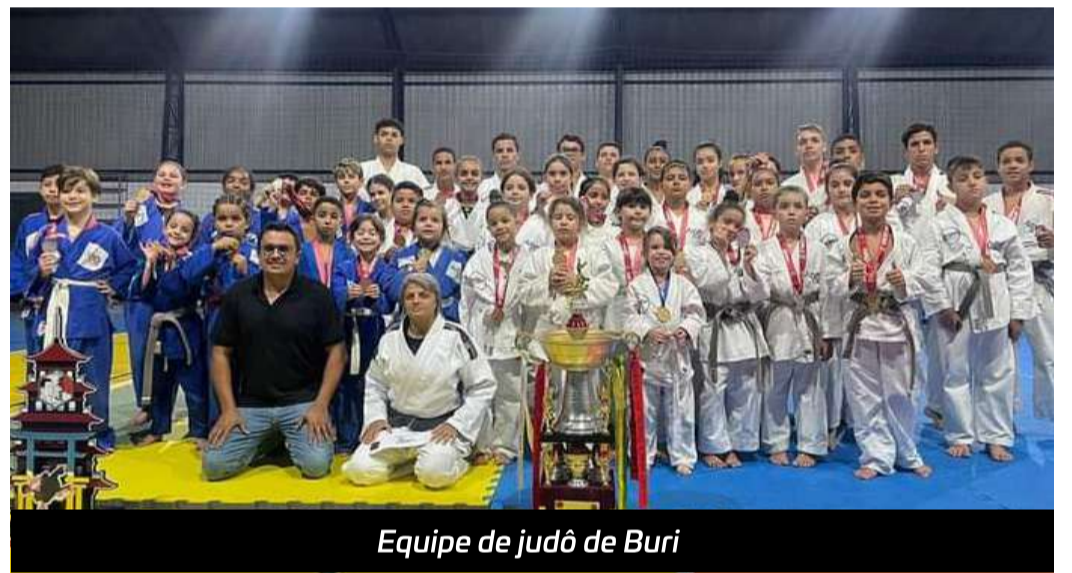
Equipe de judô de Buri