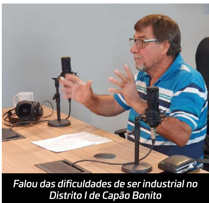
Falou das dificuldades de ser industrial no Distrito I de Capão Bonito