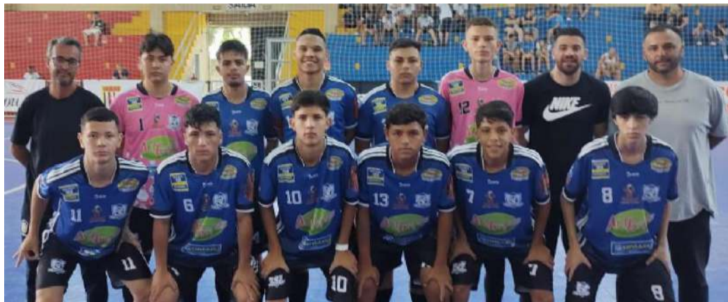
Sub-18 da AECB perdeu de virada e foi eliminado do Metropolitano de futsal

A equipe Sub-18 da AECB foi derrotada no último domingo em São Paulo em jogo vá-