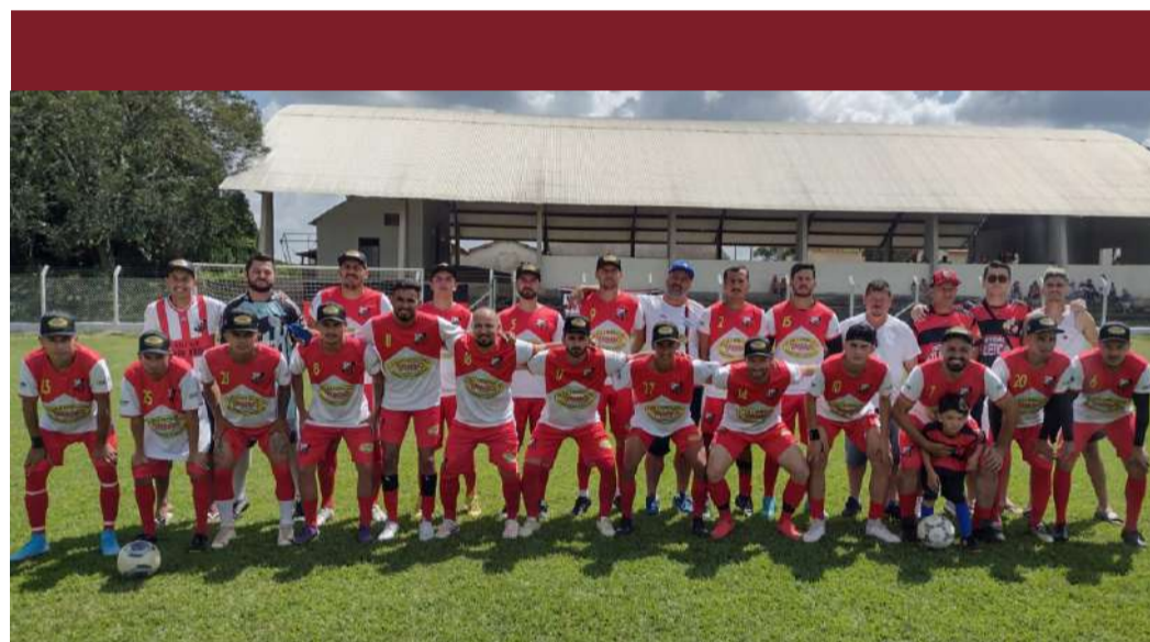
Atlético Capão Bonito enfrentará o Ferreira dos Matos

Em caso de empate as equipes decidirão a vaga na próxima fase através da cobrança de pênaltis.