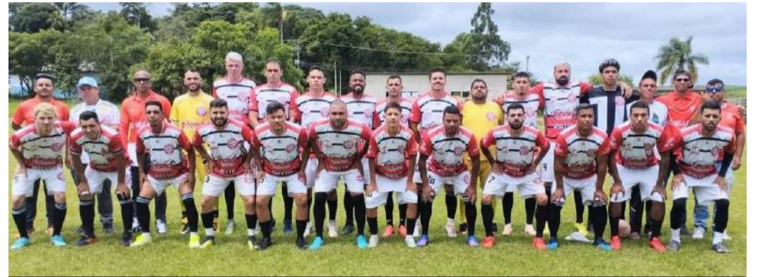
E.C. Bela Vista enfrentará o River de Buri pela Copa Regional