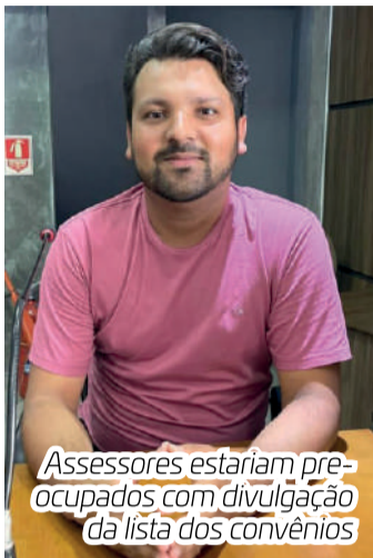
Assessores estariam preocupados com divulgação da lista dos convênios

Auxiliares do prefeito Júlio Fernando estão preocupados com o requerimento apresentado pelo vereador Daan Cabeleireiro, do PSDB de Capão Bonito, em que é pedida a relação de pessoas contratadas nos convênios. Estes auxiliares temem que o vereador dê publicidade a lista, que poderia ter casos claros de nepotismo.