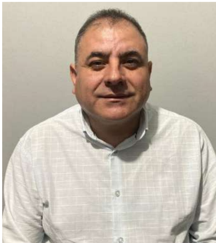
Vereador da oposição cobra diálogo da presidente da Câmara de Guapiara