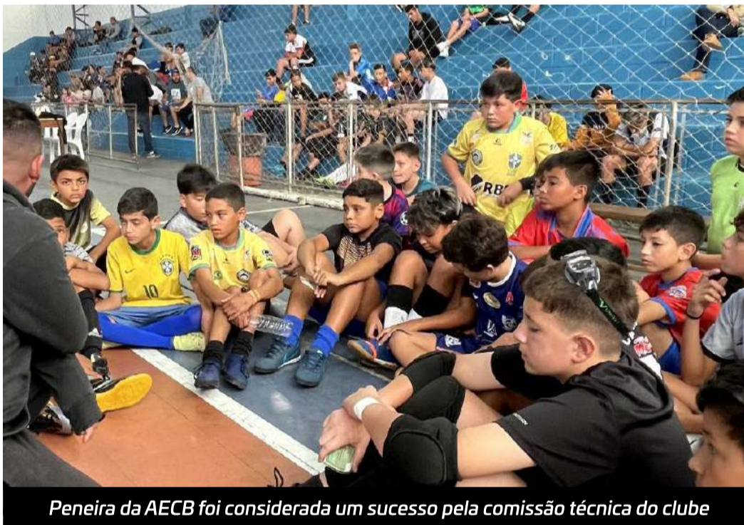
Peneira da AECB foi considerada um sucesso pela comissão técnica do clube