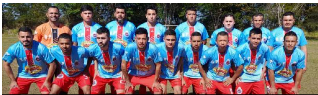
Igaratá, em má fase, sofreu nova derrota

A rodada do último domingo da Champions League Zé Macaco teve quatro jogos e nenhum empate com todos os jogos tendo equipes saindo vitoriosas e conquistando os