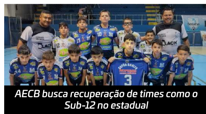
AECB busca recuperação de times como o Sub-12 no estadual