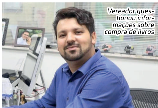
Vereador questionou informações sobre compra de livros

Um dos projetos que o vereador tucano questionou foi um destinado para compra de livros pela Secretaria de Educação. Segundo o vereador, não havia explicações sobre a quantidade de livros de Monteiro Lobato que serão comprados.