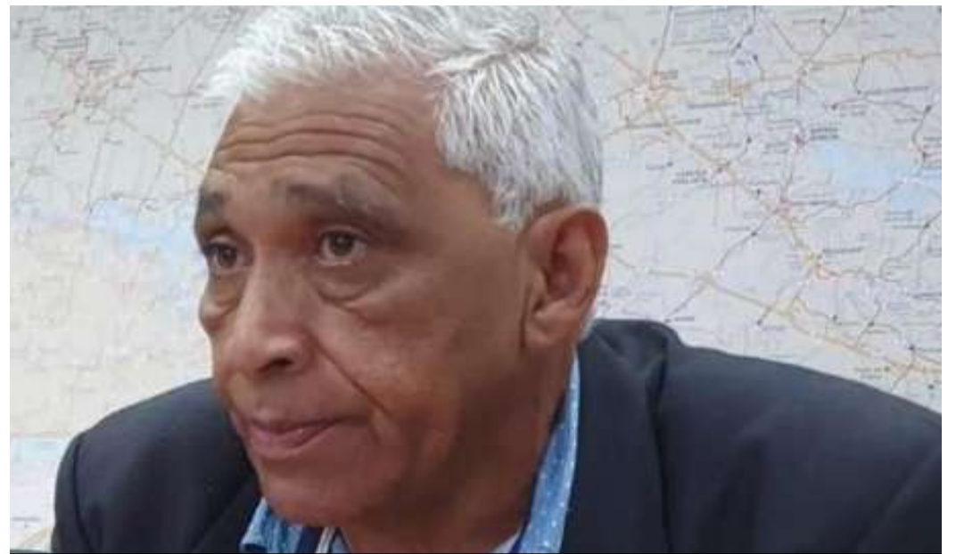
Vereador descumpriu decisão da Justiça e não pediu desculpas a ex-prefeito

O advogado do ex-prefeito já peticionou na ação informando o juiz do descumprimento da decisão judicial e pediu as providências cabíveis contra o vereador.