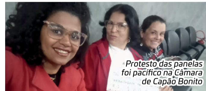
Protesto das panelas foi pacífico na Câmara de Capão Bonito

A presença de um grupo de manifestantes na última sessão da Câmara de Capão Bonito, teria deixado alguns vereadores preocupados. O grupo, que estava munido de panela, foi até a sede do Legislativo para protestar contra a declaração do vereador Fio Londrina, que tinha mandado seus críticos irem lavar panelas.