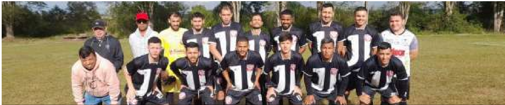
Bela Vista goleou o Colorado e garantiu vaga na semifinal da Champions Zé Macaco

A rodada do último final de semana definiu as quatro equipes que irão disputar as semifinais da Champions League Zé Macaco que está sendo realizada no campo da antiga Brisauto. Valendo