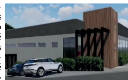
Filme sobre hospital seria ilusionista segundo oposição

Membros da oposição em Guapiara dizem que o filme lançado pelos assessores do prefeito como sendo o futuro novo hospital municipal, é mais um trabalho de ilusionista dos situacionistas. Segundo os opositoristas, o lançamento do filme é uma tentativa de aliados do prefeito para tentar diminuir seu desgaste pelo fechamento do hospital.