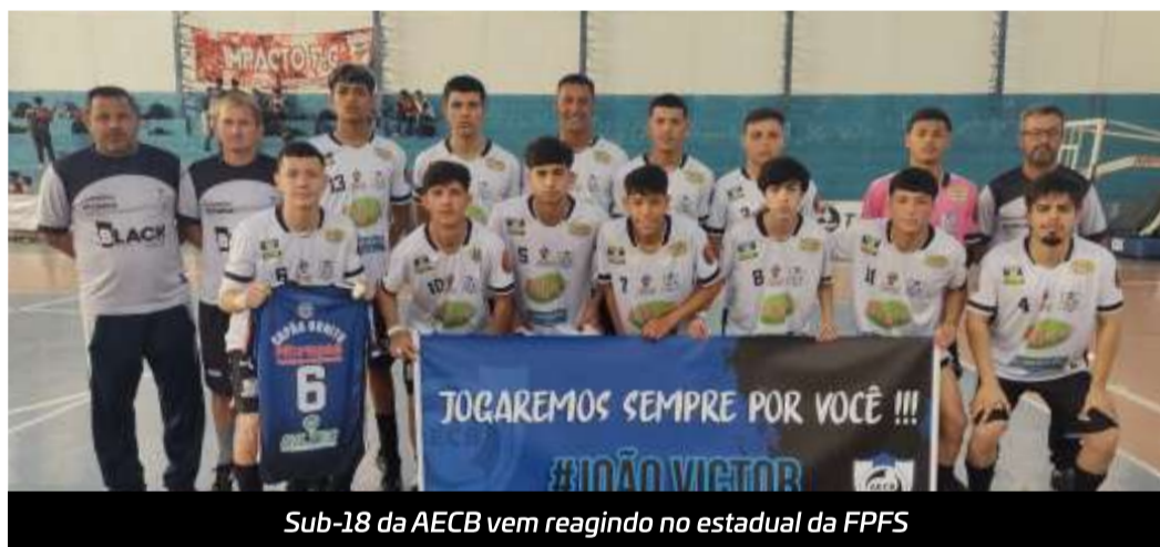
Sub-18 da AECB vem reagindo no estadual da FPFS