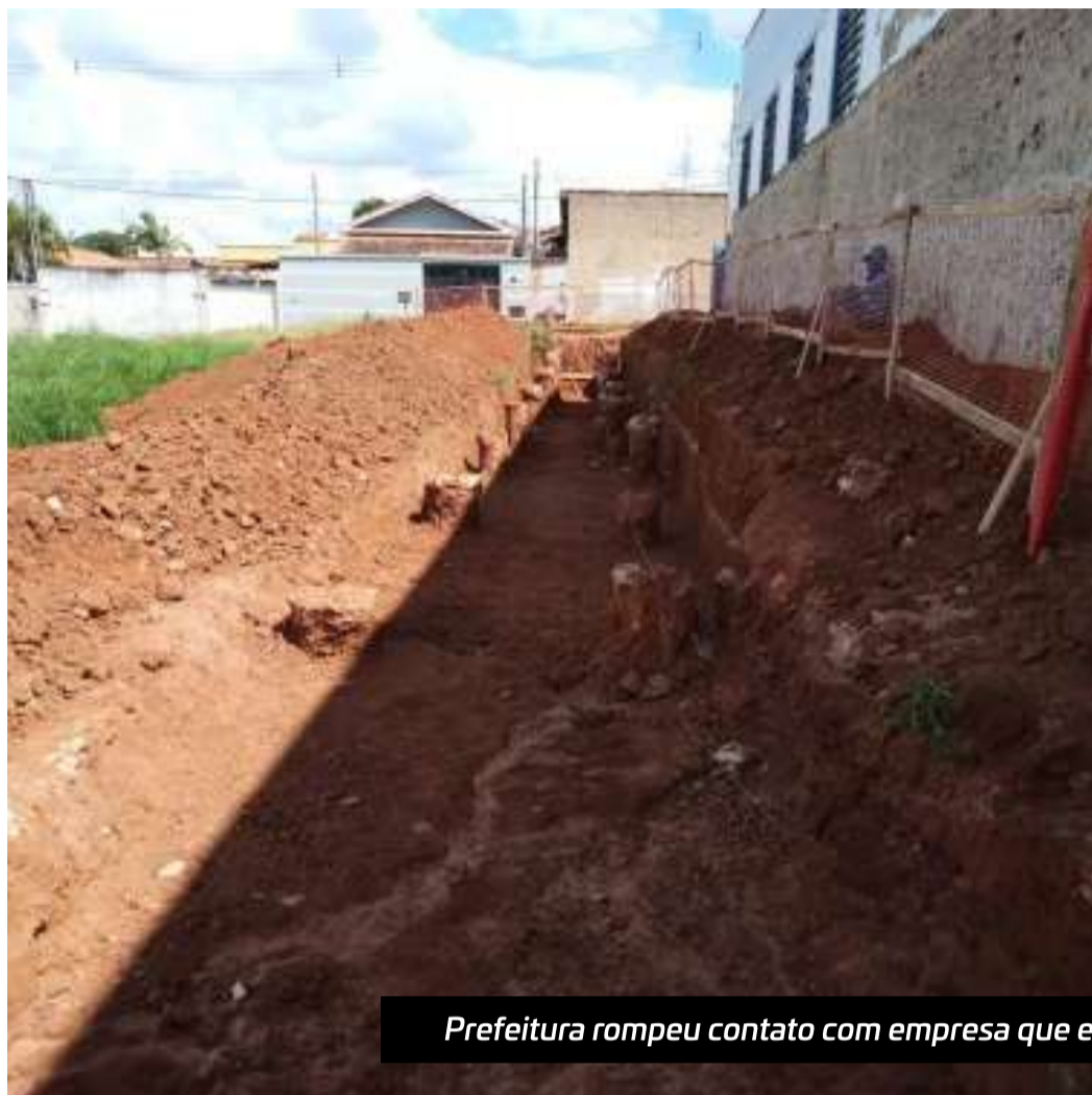
Prefeitura rompeu contato com empresa que estava reformando a escola da Nova Capão Bonito