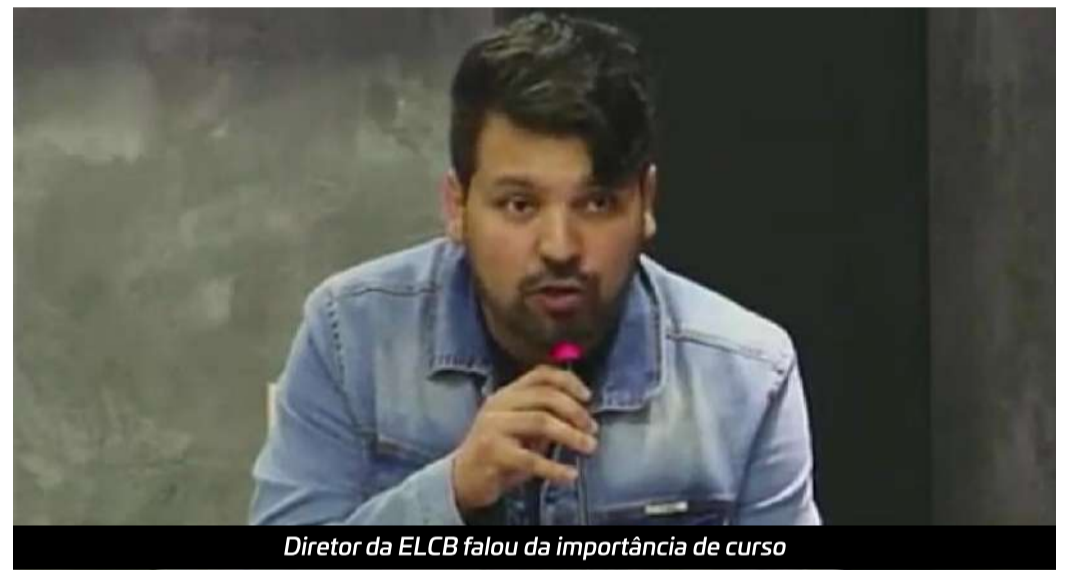
Diretor da ELCB falou da importância de curso

O curso será realizado no plenário da Câmara de Capão Bonito, das 8h30 até as 17 horas e as inscrições podem ser feitas pelo link https://escoladolegislativo.camaracb.sp.gov.br/curso-sobre-as-emendas-impositivas-e-suas-aplicacoes/ até o dia 21 de agosto.