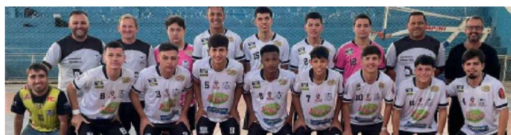
Sub-18 da AECB perdeu para Clube de Campo de Tatuí e está fora do Estadual de futsal

disseram membros da comissão técnica da AECB.