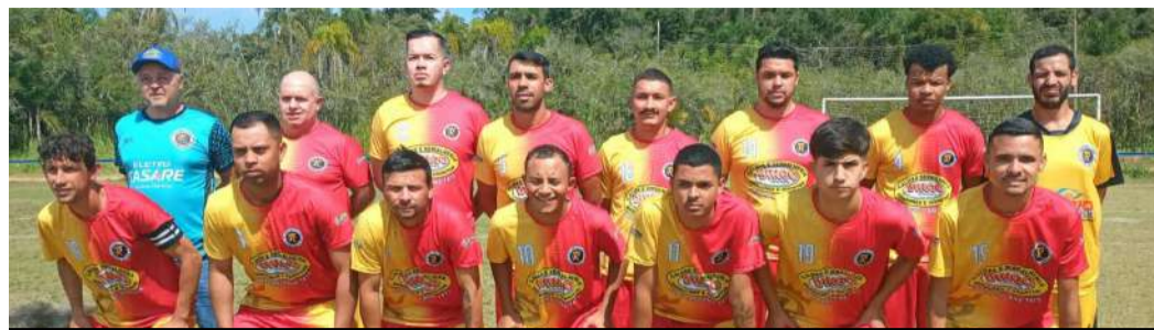
Esporte enfrenta Paulo Power Ball pelo Regional de Ribeirão Grande

As fortes chuvas que caíram na região no último final de semana motivaram o cancelamento da rodada do Campeonato Regional de Futebol que está sendo disputado no campo do Centro Po-