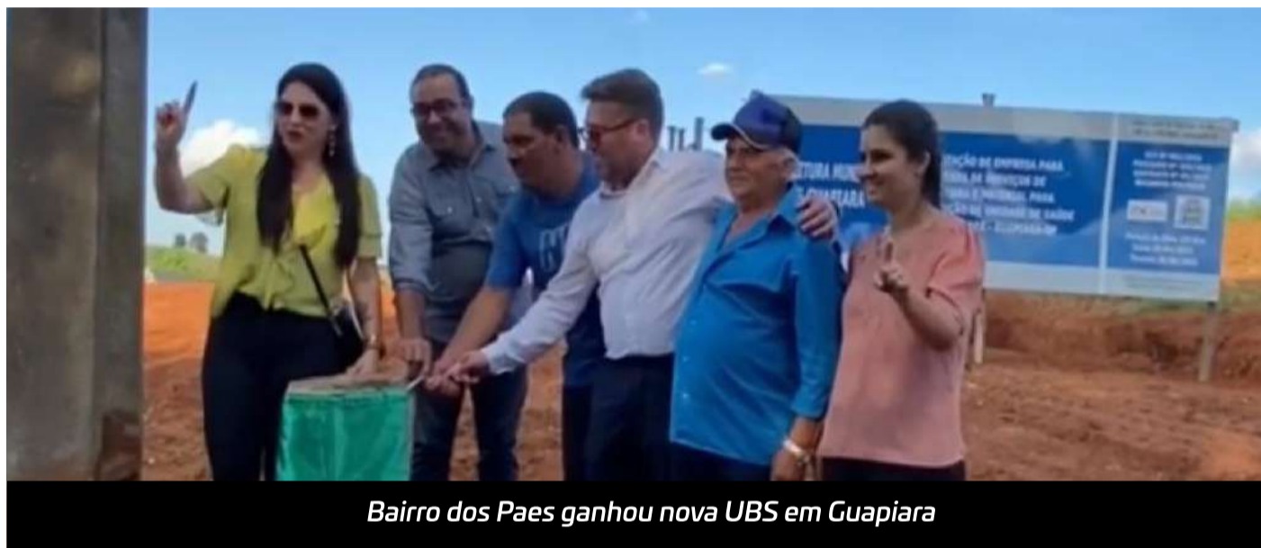
Bairro dos Paes ganhou nova UBS em Guapiara

A prefeitura de Guapiara entregou na semana passada um novo posto de saúde para o bairro dos Paes, um dos mais populosos do município.