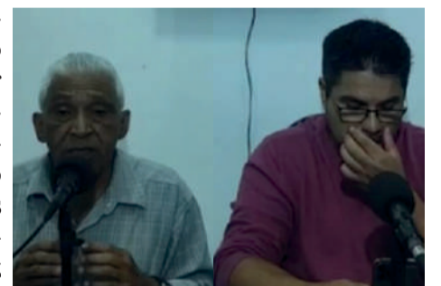
Vereador aliado a prefeito atacou governo estadual

Depois do prefeito de Capão Bonito, Júlio Fernando, ter criticado o governo federal chegando a dizer que os petistas irão quebrar os municípios e o país, na semana passada foi a vez de aliados do prefeito direcionarem suas metralhadoras para o governador Tarcísio de Freitas. O vereador Fio Londrina fez duras críticas ao governo estadual num programa aliado.