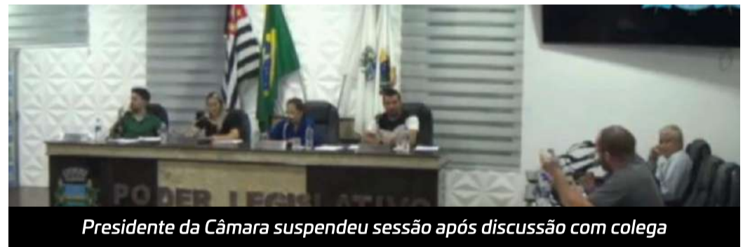
Presidente da Câmara suspendeu sessão após discussão com colega

Com o comportamento do vereador situacionista a presidente decidiu encerrar a sessão.