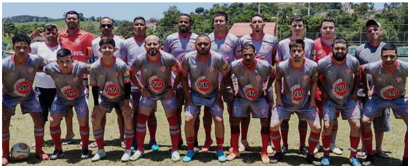
E.C. Bela Vista venceu clássico e avançou no Regional

próxima fase serão conhecidos na cobrança de pênaltis.