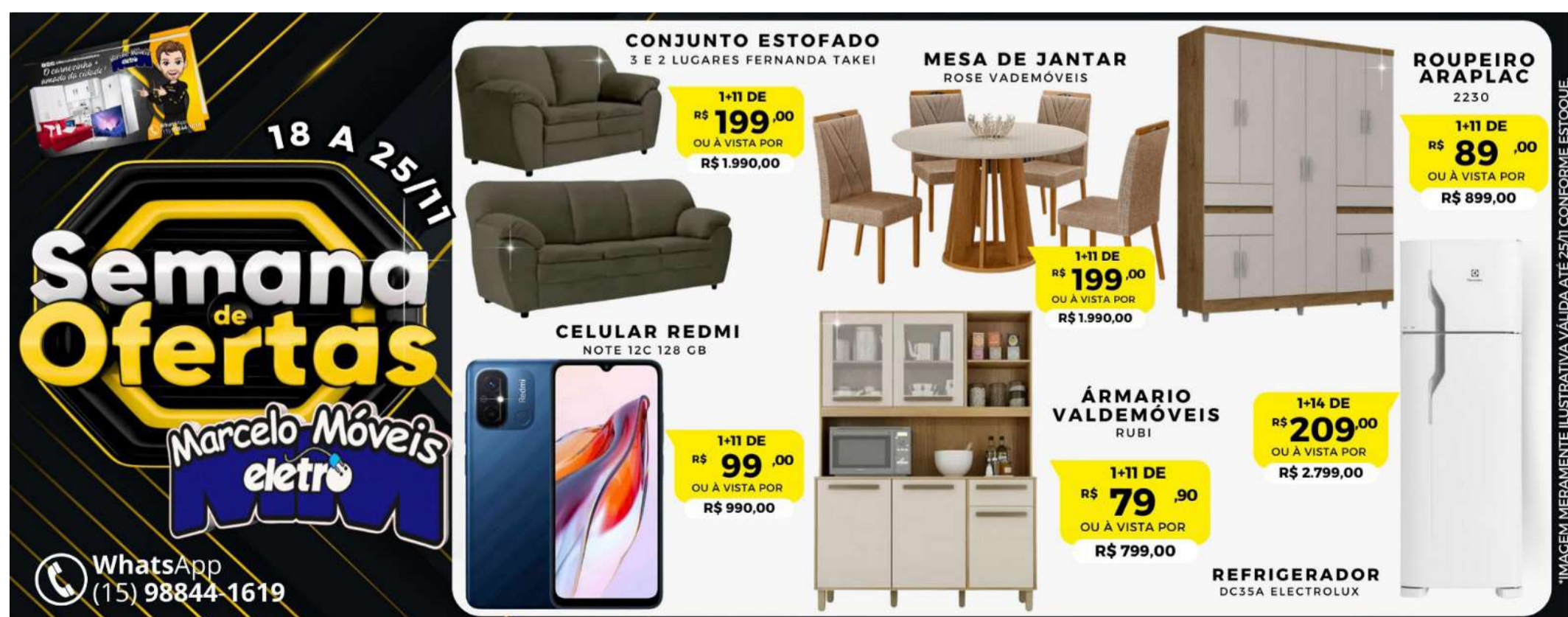
*IMAGEM MERAMENTE ILUSTRATIVA VÁLIDA ATÉ 25/11 CONFORME ESTOQUE

montando seu prato com metade de verduras e legumes, adicionar fontes de carboidratos integrais, como por exemplo: pão integral, arroz integral, macarrão integral, e incluir uma fonte de proteína, como carnes magras, ovos, leite e derivados. Consuma frutas pelo menos de 2 a 3 vezes por dia, pratique exercícios físicos, e fuja de frituras, alimentos industrializados e embutidos”, reforça a nutricionista.