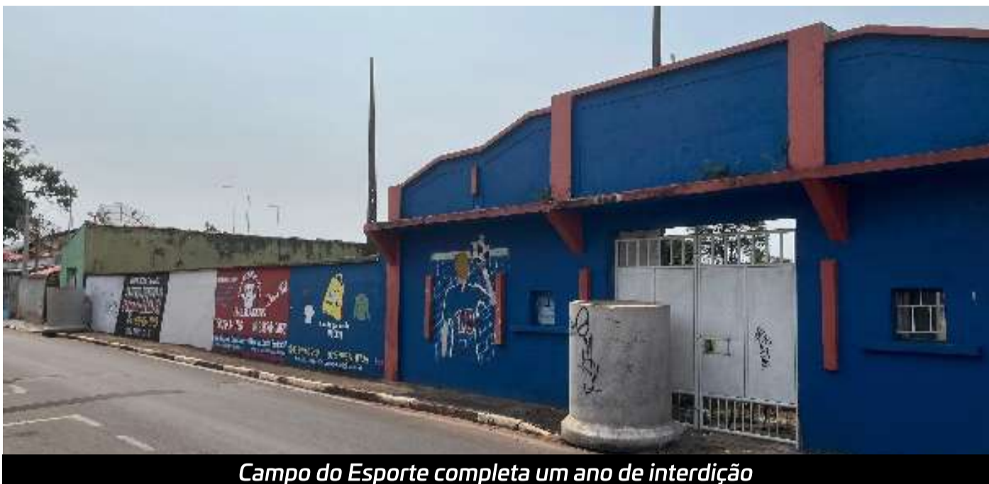
Campo do Esporte completa um ano de interdição

“Eles poderiam ter dado acesso do processo para a diretoria do Esporte para que uma reforma fosse feita, mas impossibilitaram isso, além disso, mesmo com o campo estando abandonado, o muro não caiu então era possível uma recuperação. Pelo jeito a administração tem outros projetos para o local”, disseram esportistas ligados ao futebol varzeano da cidade.