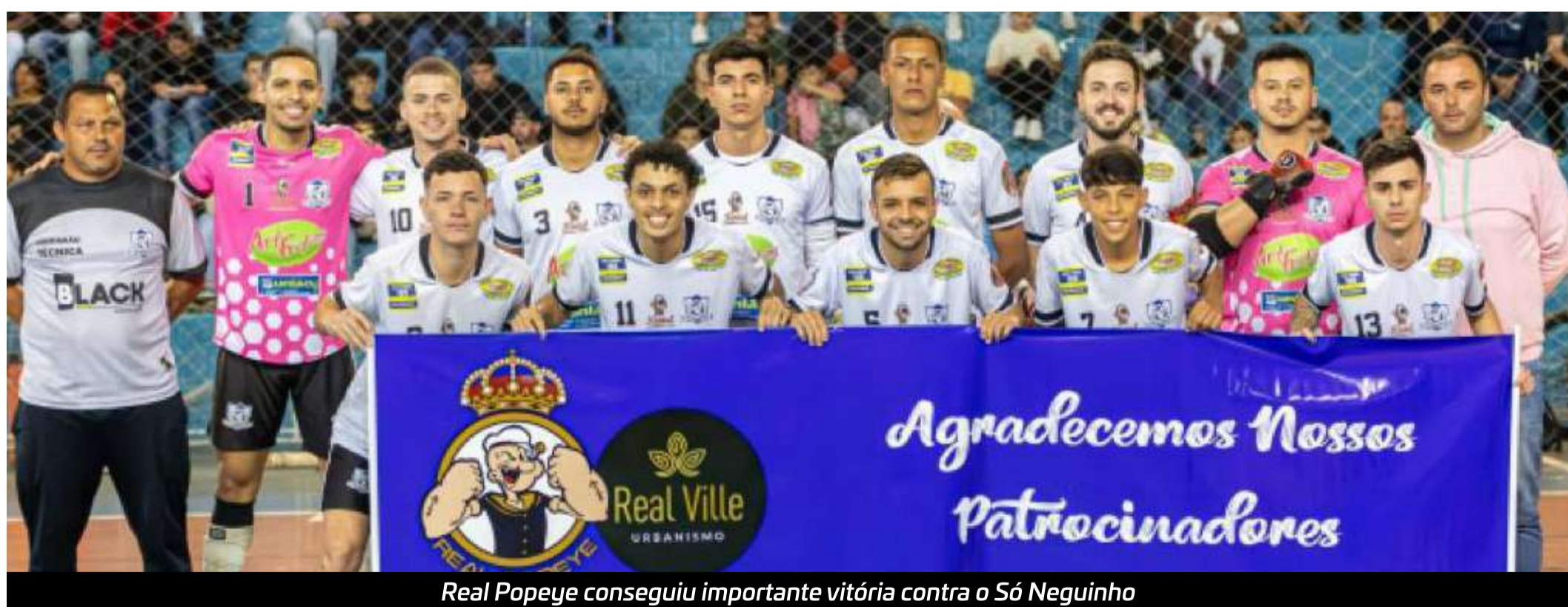
Real Popeye conseguiu importante vitória contra o Só Neginho

As duas últimas rodadas da Copa Regional de Futsal Calhas e Serralheria Dingo tiveram jogos emocionantes e que já começam decidir as equipes que continuarão na competição.