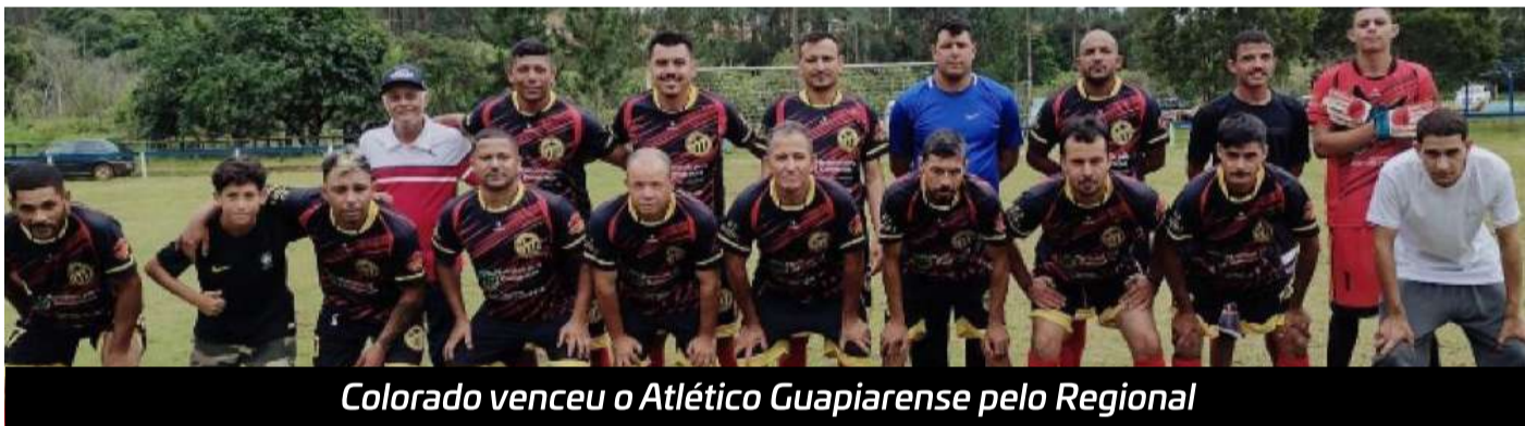
Colorado venceu o Atlético Guapiarense pelo Regional

se enfrentam Bagaçu City e Grêmio Bela Vista e às 15 horas será a vez do confronto entre E.C Bela Vista e Atlético Bitão.