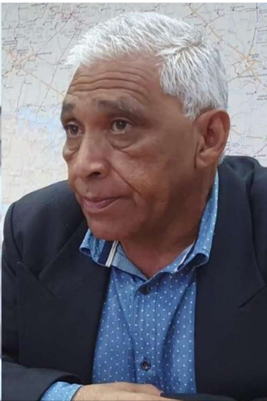
O Expresso enviou cópias de áudio de secretário e vereador para Polícia Civil