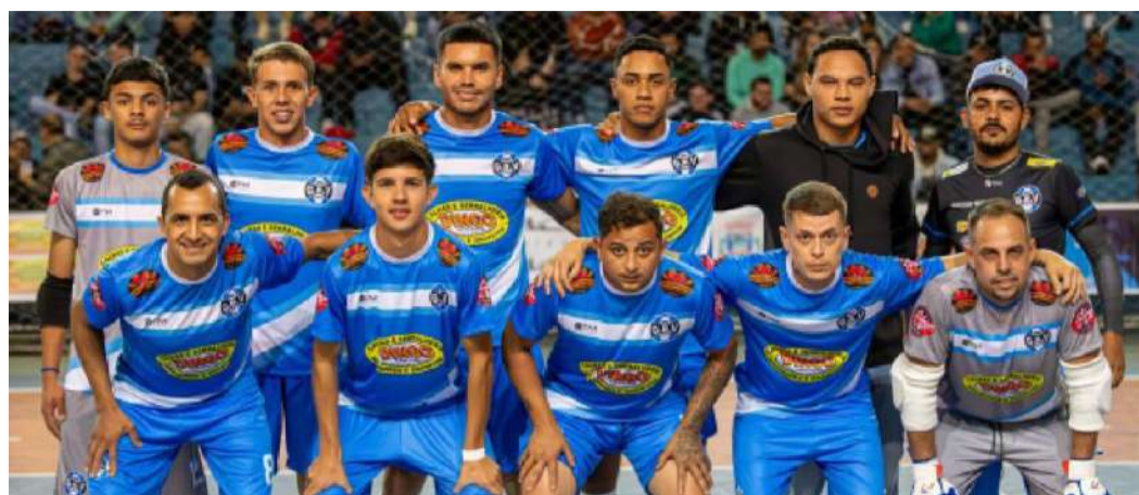
Grêmio Bela Vista fez boa partida contra o Torre de Pedra

A Copa Regional de Futsal Calhas e Serralheria Dingo, que está sendo disputada no Ginásio de Esportes José Elias de Proença, tem