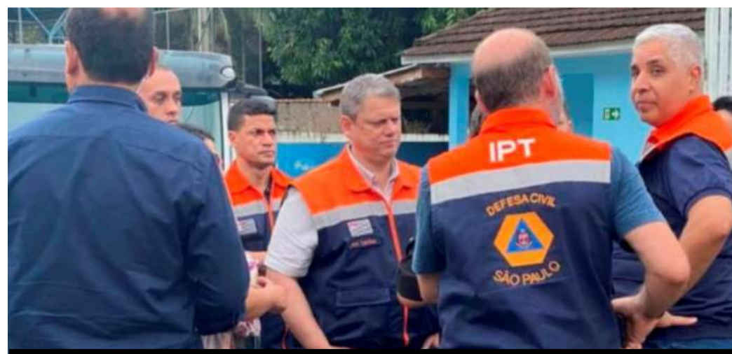
Governador Tarcísio de Freitas esteve em Ribeira

A princípio, algumas medidas estão sendo tomadas para dar amparo à população, as famílias que foram desabrigadas