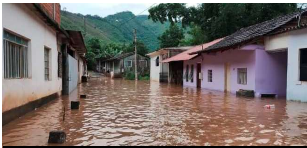
Casas atingidas pelas chuvas em Ribeira

O governador de São Paulo, Tarcísio de Freitas, esteve na manhã de terça-feira, em Ribeira, que se encontra em situação crítica, após as fortes chuvas que atingiram a região