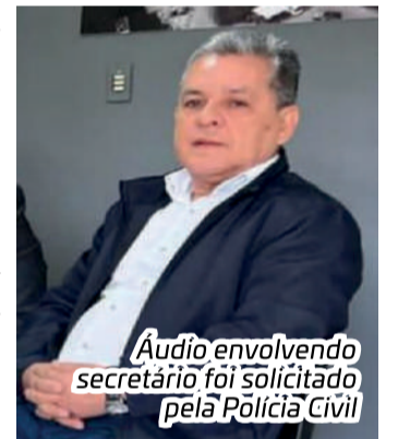
Áudio envolvendo secretário foi solicitado pela Polícia Civil