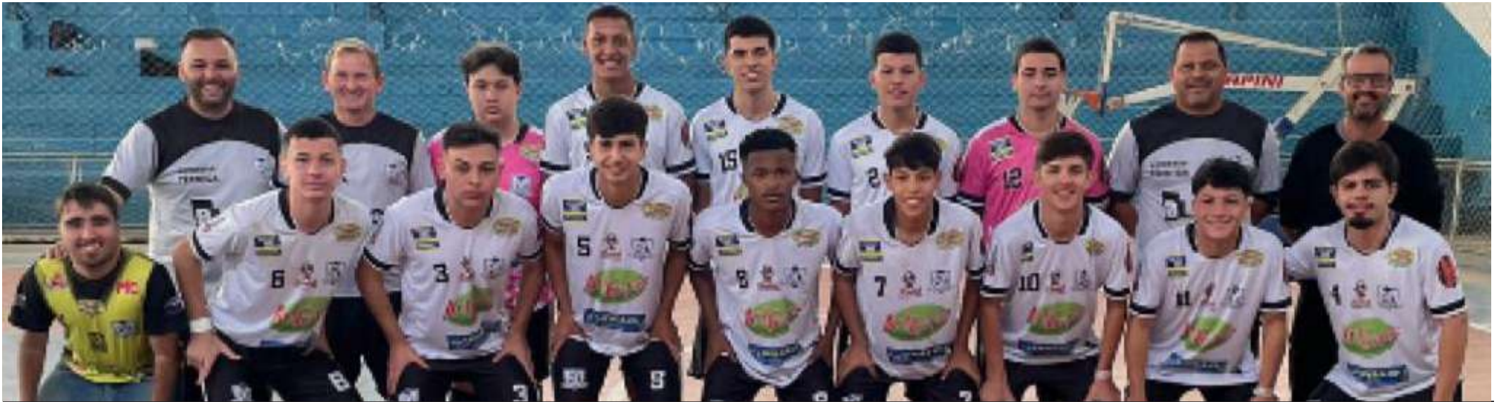
Equipes da AECB vão disputar Campeonato da Federação Paulista de Futsal

As equipes de base da Associação Esportiva Capão Bonito devem começar nos próximos dias a preparação visando os campeonatos que serão promovidos pela Federação Paulista de Futsal.