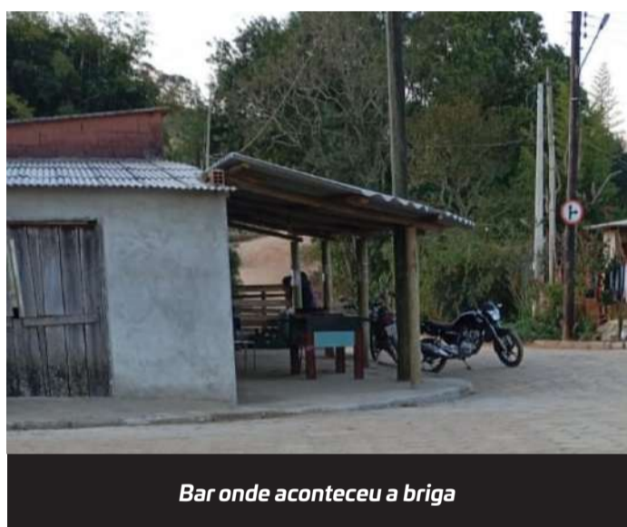
Bar onde aconteceu a briga

A moradora e agricultora do bairro do Santana de Guapiara e seus filhos alegam