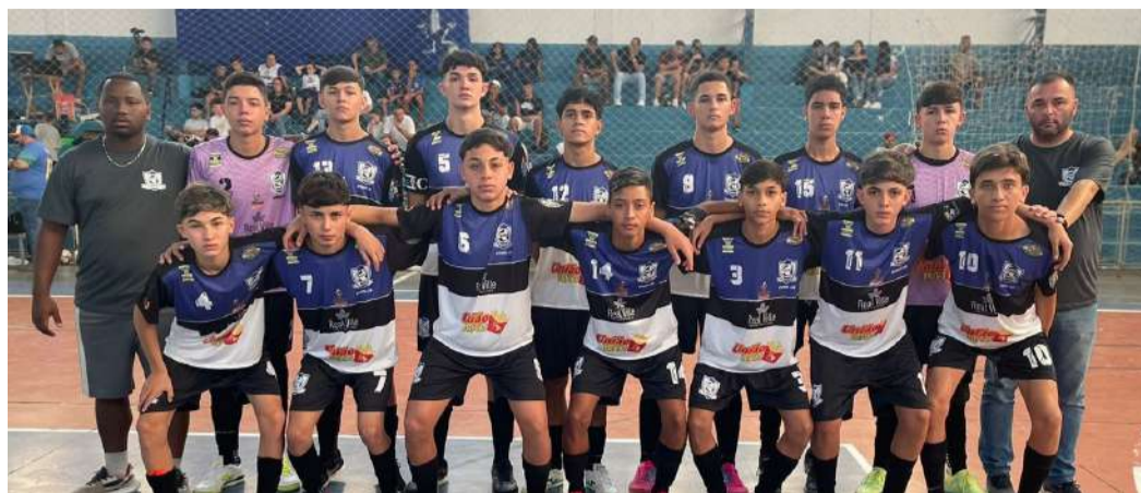
Time Sub-16 da AECB conseguiu mais uma vitória pelo Estadual de futsal de base

Ernesto Diogo de Faria, na cidade de Caieiras, para enfrentar os times da E.F Atlético Mangalot. Principalmente o time Sub-18 entra em quadra tentando reagir na competição para buscar a classificação, já o Sub-16 joga para confirmar seu bom desempenho. Os times Sub-14 e Sub-12, como era previsto no começo da disputa, estão buscando ganhar experiência na competição.