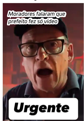
Moradores falaram que prefeito fez só vídeo

Moradores ouvidos por esta coluna disseram que o prefeito fez o vídeo no local, mas sequer conversou com eles ou voltou ao local. Esses moradores chegaram a usar esguichos de suas residências para evitar que o fogo que atingiu uma plantação de pinus atingisse as casas.