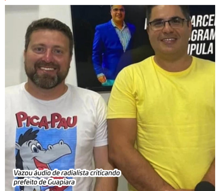
Vazou áudio de radialista criticando prefeito de Guapiara