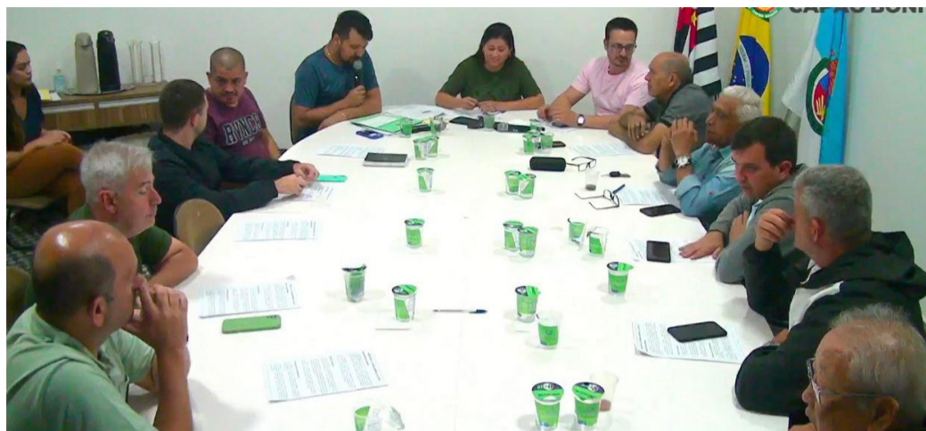
Câmara vai analisar pedido de CPI na próxima sessão

O denunciante recomendou que o Legislativo local instaure uma CPI (Comissão Parlamentar de Inquérito) para investigar o caso e apresentou todas as condições para isso embasado na legislação vigente. A denúncia foi lida por determinação da presidência da Casa de Leis e será analisada na sessão do dia 09.