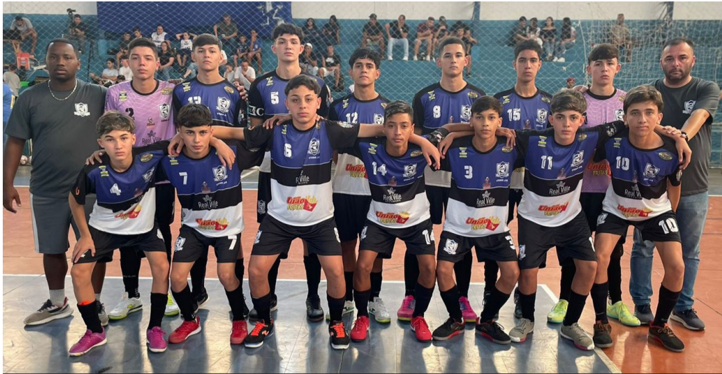
Time Sub-16 da AECB conseguiu mais uma vitória pelo Estadual de futsal de base

Jogando fora de casa em mais uma rodada do Campeonato Estadual de Futsal para categorias de base da Série A2, que é promovido pela Federação Paulista de Futsal, as equipes da AECB (Associação Esportiva Capão Bonito) conseguiram bons resultados no último domingo contra os times da E.F Atlético Mangalot, da cidade de Caieiras, na Grande São Paulo.