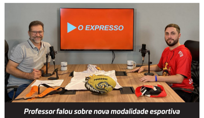
Professor falou sobre nova modalidade esportiva