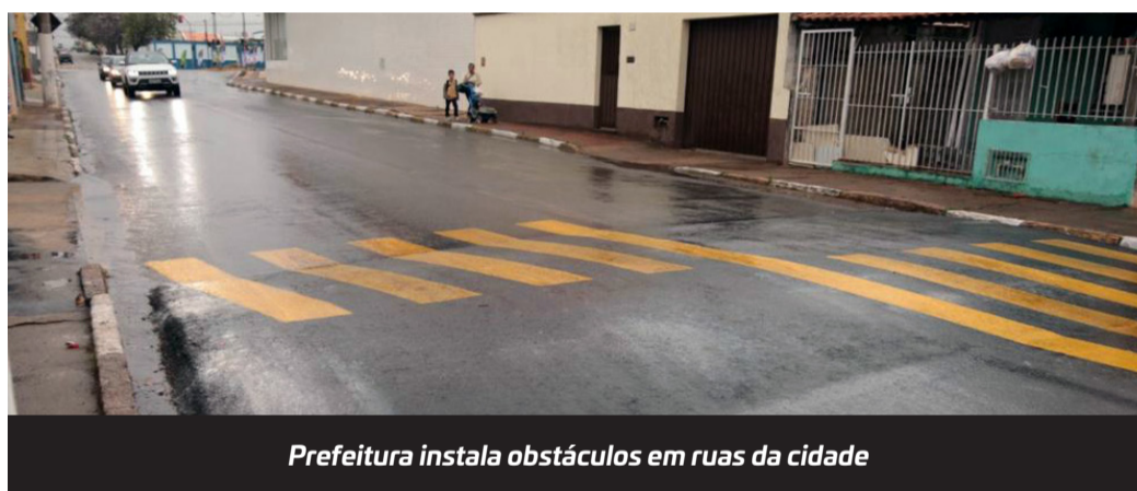
Prefeitura instala obstáculos em ruas da cidade

que o político achou exagerado. Motoristas também criticaram alguns dos obstáculos que foram construídos perto de onde já havia outro redutor e citam como exemplo a rua Altino Arantes no cruzamento com a rua General Carneiro.