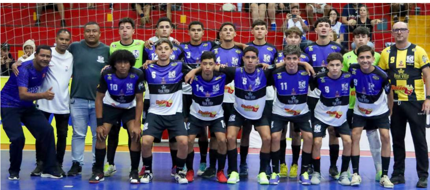
Sub-16 da AECB está na semifinal do Estadual de futsal de base