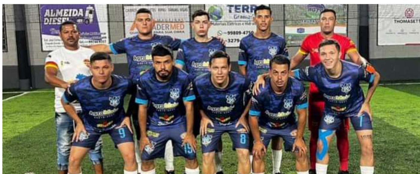
Vila Aparecida conseguiu importante resultado na Copa Dingo

A equipe do Vila Aparecida/Futsal conseguiu um excelente resultado pela 1ª Copa Dingo de Futebol Society que está sendo disputada no campo do Asilo em Capão Bonito.