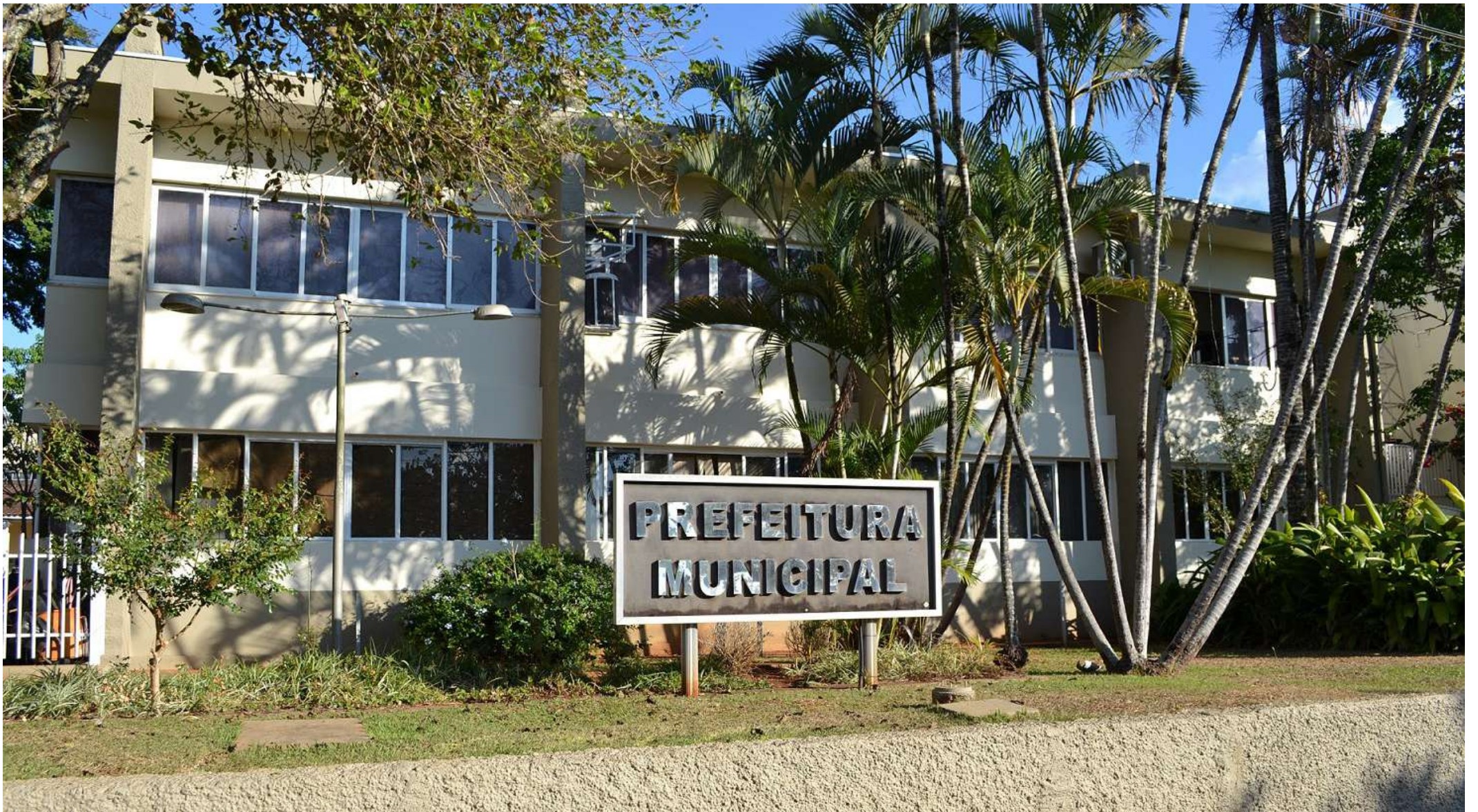
Prefeitura está há 4 anos falando em reforma administrativa

Seguindo a série de matérias que O Expresso tem feito nas últimas semanas sobre desafios que deverão ser enfrentados no próximo mandato, que terá início em janeiro de 2025, a reportagem do jornal traz esta semana um levantamento sobre os desafios a serem enfrentados na relação com o funcionalismo público municipal.