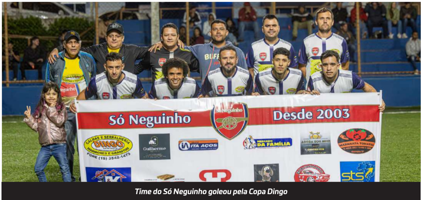
Time do Só Neguinho goleou pela Copa Dingo

Na rodada da última quarta-feira, dia 06, mais três jogos agitarão a competição. Na primeira disputa o time do Arena Futsal venceu o Resenha F. C. por 5 a 3, na segunda partida da rodada, foi a vez do confronto do Vila Aparecida F.C e do Quase Gol, melhor para o time do técnico Rodrigo Lopes, que venceu por 5 a 4, e fechando a rodada, foi a vez do duelo entre Vila São Paulo e Bayer RB, melhor para o time da Vila São Paulo que venceu por 7 a 1.