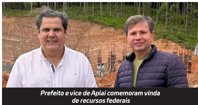
Prefeito e vice de Apiaí comemoram vinda de recursos federais

O município de Apiaí e o governo federal celebraram no mês de