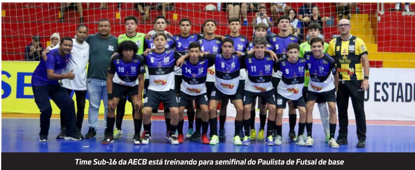
Time Sub-16 da AECB está treinando para semifinal do Paulista de Futsal de base

Os jogadores do time Sub-16 da AECB (Associação Esportiva Capão Bonito), que disputam o Campeonato Estadual de Futsal para categorias de base da Série A2, estão em fase de aprimoramento nos treinamentos para disputar a semifinal da competição na Série Prata contra a equipe da União Mauá.