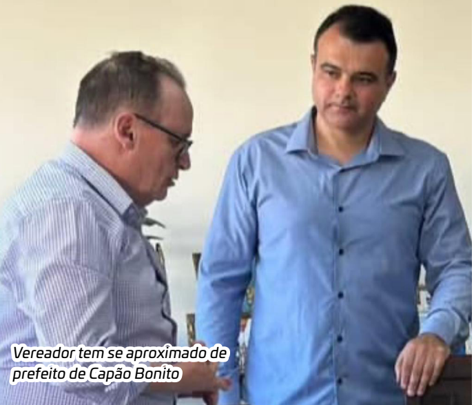
Vereador tem se aproximado de prefeito de Capão Bonito

As contas do prefeito de Capão Bonito relativas ao ano de 2023 já chegaram à Câmara local para análise dos vereadores. O relatório do TCE teve inúmeros apontamentos e o Ministério Público de Contas deu parecer pela rejeição das contas.