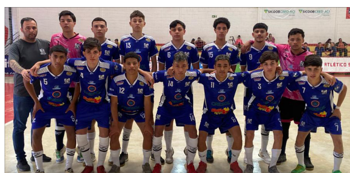
Time Sub-16 da AECB precisa vencer na rodada do Paulista

O time Sub-16 está na 8ª colocação, o Sub-14 está na 12ª colocação e o time Sub-12 no 11º lugar no grupo.