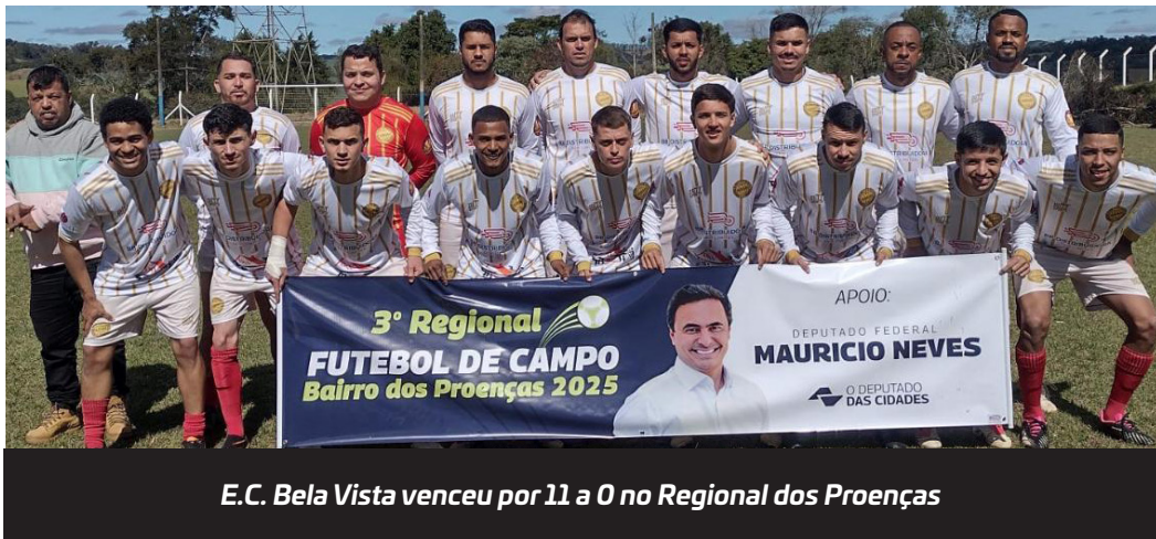
E.C. Bela Vista venceu por 11 a 0 no Regional dos Proenças

O 3º Campeonato Regional de Futebol de campo que está sendo promovido por espor-