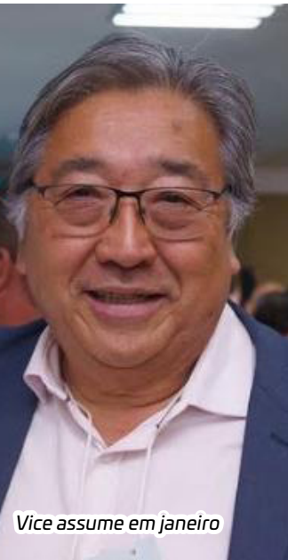
Vice assume em janeiro

Além deste assessor que estaria recluso e proibido de entrar no gabinete, um outro assessor de longa data do prefeito também estaria em baixa com o chefe. Mas não seria exonerado, porque esse assessor saberia demais. Se manterá no cargo, pelo menos por enquanto.