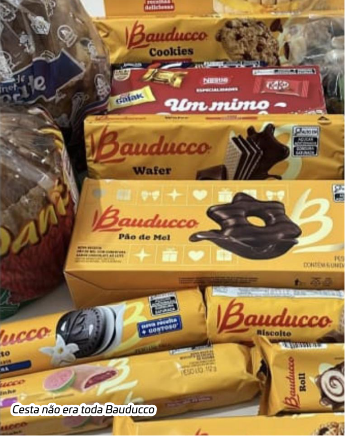
Cesta não era toda Bauducco

No áudio, a servidora que resolveu um problema que não era de sua responsabilidade, afirma que a maioria dos panetones estava mofada, mas seriam trocados. Comenta-se nos corredores do paço municipal, que antes mesmo de terem sido entregues todas as cestas, já teriam sido contabilizados 200 panetones mofados.