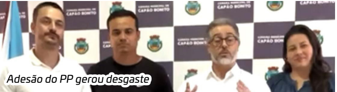
Adesão do PP gerou desgaste

Para um especialista em administração pública, a contratação de um empréstimo de 25 milhões de reais pela prefeitura de Capão Bonito no momento em que é praticada a maior taxa Selic da história no país, é uma temeridade. Esse especialista calcula que as prestações do empréstimo poderão custar o mesmo que duas vezes o que o município gasta com contas de energia mensalmente, que passa de 350 mil reais.