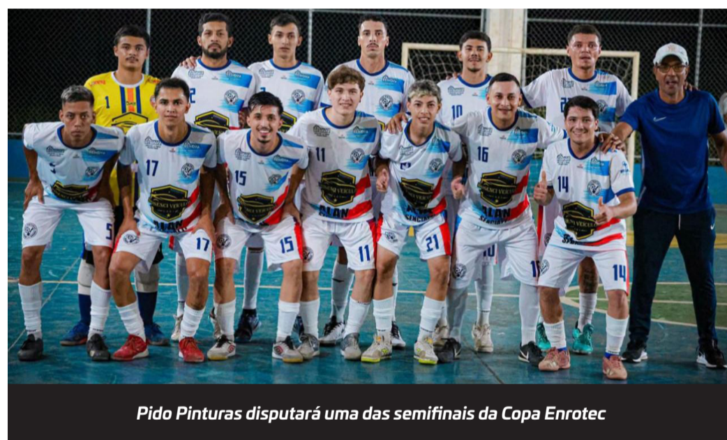
Pido Pinturas disputará uma das semifinais da Copa Enrotec

semifinais, a organização decidiu adiar a sequência da competição e estuda a possibilidade de trazer arbitragem de Itapetininga. Os jogos foram programados para o dia 25, num sábado, a pedido das equipes que já tinham outras competições programadas para os dias anteriores.