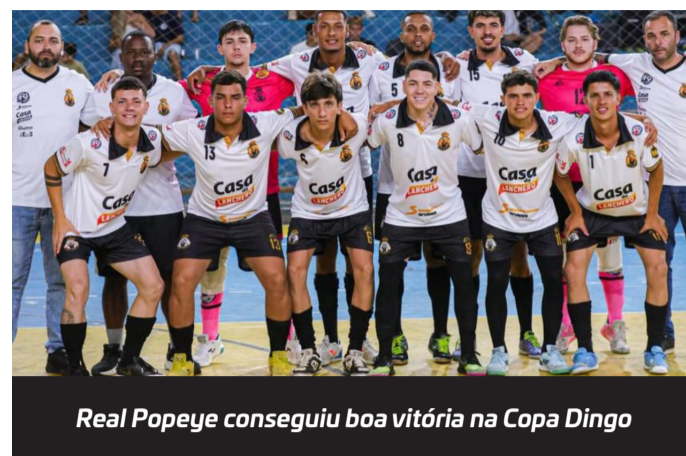
Real Popeye conseguiu boa vitória na Copa Dingo

do Grêmio Bela Vista e do Alpha. E quem saiu com a vitória foram as meninas do GBV que venceram com folga por 6 a 1. Em seguida jogaram pela categoria Veterano os times do Vila Nova, de São Miguel Arcanjo, e do Botafogo, de Capão Bonito, quem levou a melhor foi o Vila Nova que venceu por 16 a 0. E fechando a rodada, foi a vez do duelo entre