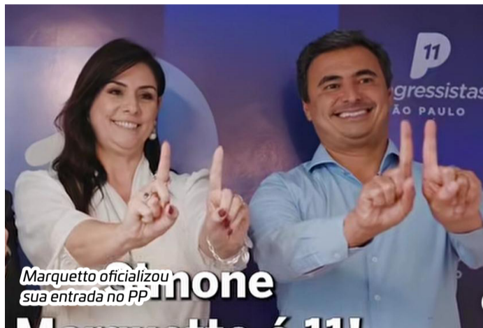
Marquetto oficializou sua entrada no PP

A deputada federal de Itapetininga, Simone Marquetto, oficializou essa semana sua saída do MDB e entrada no PP. Marquetto não deverá ser mesmo candidata a um novo mandato e deverá coordenar a campanha do deputado Mauricio Neves na região de Sorocaba.