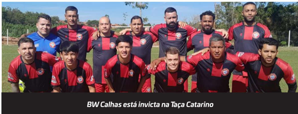
BW Calhas está invicta na Taça Catarino

A rodada do último domingo da Taça Catarino Aleixo, que está sendo disputada no campo de futebol da Vila Aparecida, teve dois jogos no último domingo valendo pela fase de grupos da competição.