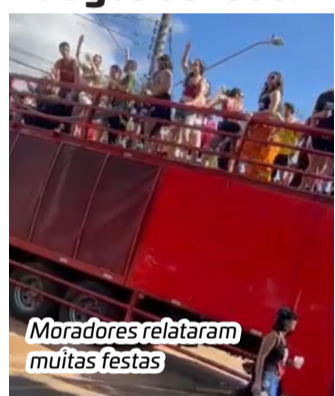
Moradores relataram muitas festas

Já moradores que se sentiram prejudicados pelo barulho intenso por 4 dias chegaram a dizer que os jogos eram fachadas para festas que aconteciam depois das competições. Para muitos, o evento estava mais para festa rave, do que para competição esportiva.