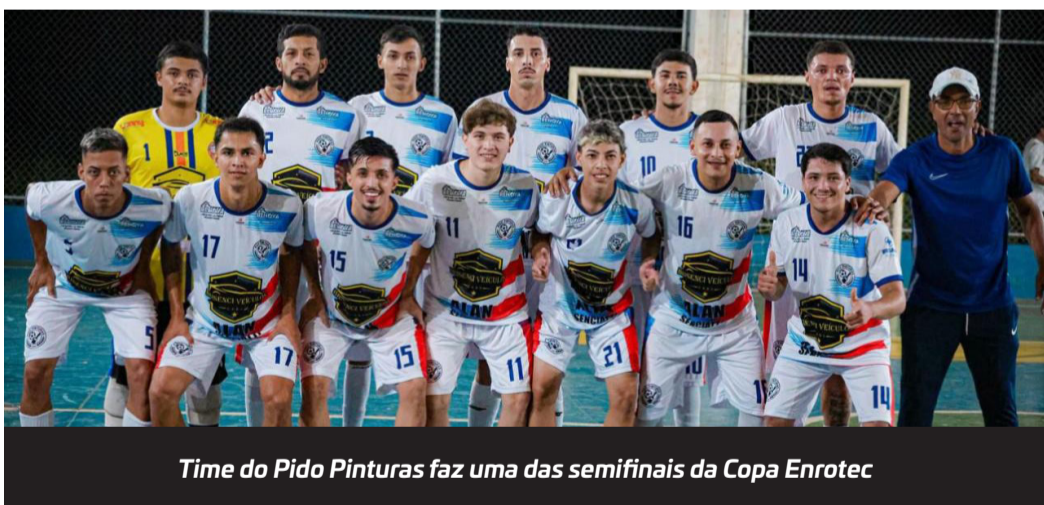
Time do Pido Pinturas faz uma das semifinais da Copa Enrotec

As semifinais da Copa Enrotec de Futsal acontecerão na noite deste sábado com previsão de início para as 19h30.