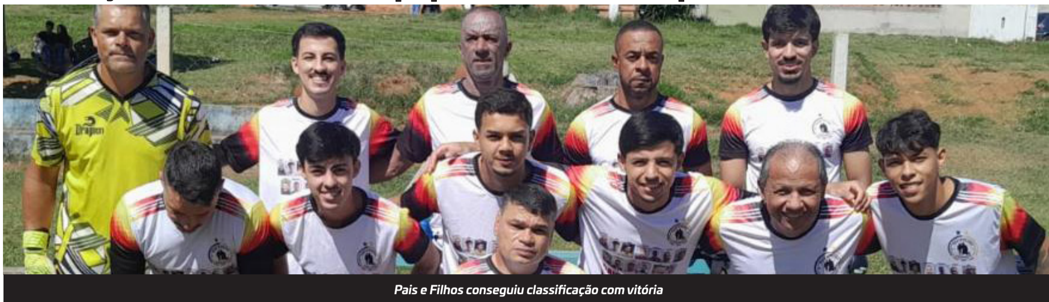
Pais e Filhos conseguiu classificação com vitória

A fase de grupos da 1ª Taça Catarino Aleixo, que está sendo disputada no campo de futebol da Vila Aparecida, sob organização da ARVA (Administração Regional da Vila Aparecida) teve no último domingo a realização da rodada que definiu as equipes que se classificaram para a fase de eliminatórias da competição.